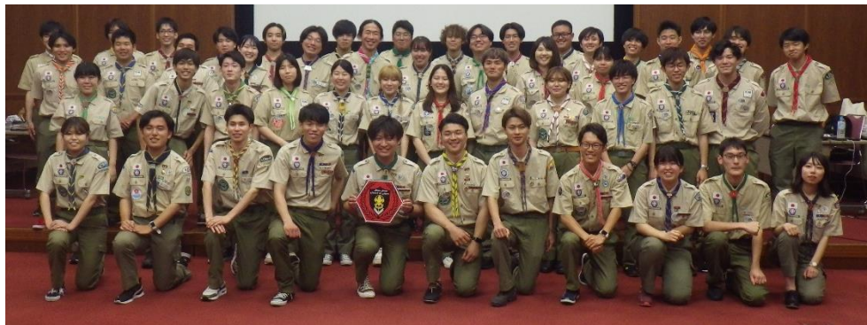
2023年度 RCJ 総会(岡山市)